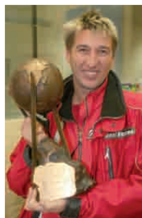
Mit berechtigtem Stolz präsentiert Klaus Sulzenbacher den 1988 errungenen Welpokal der nordischen Kombinierer.