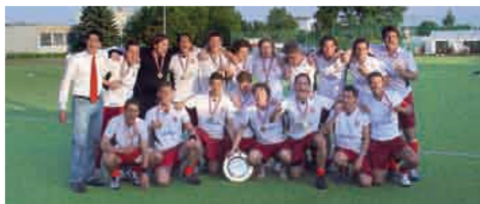
Post SV – ein Meisterteam des ASVÖ mit großen Plänen.