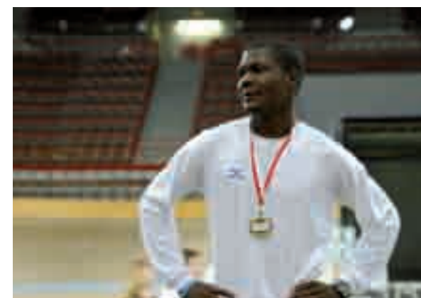
Mit Sieg in Wien zum Vize-Weltmeistertitel in Moskau: California Molefe (Botswana)

Nähere Informationen auf der Veranstaltungs-Homepage www.vienna-indoor.at