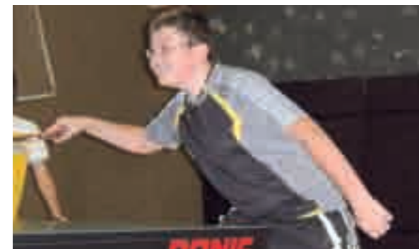
Schüler beim Training